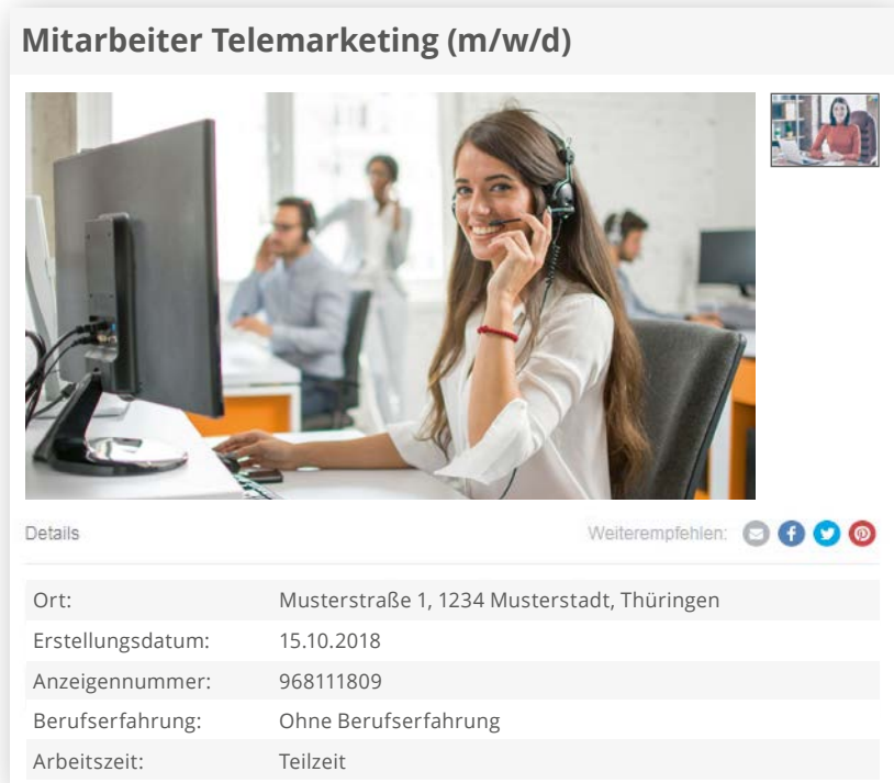
Beispiel: MRB-Technologie auf Ebay Kleinanzeigen

* Die MRB-Technologie ist nur in Kombination mit einer Stellenanzeige auf einem unserer regionalen Online-Stellenportale zu buchen. Der Preis beträgt pro MRB-Technologieanwendung und gewähltem Paket 250,- € zzgl. MwSt. Anmerkung: Es besteht keine Garantie für die Veröffentlichung der Stellenanzeige auf bestimmten Webseiten bzw. in bestimmten Apps. Die Ausspielung erfolgt performancebasiert durch die Joblokal Nordbayern GmbH. Die Umsetzung erfolgt innerhalb von 48h werktags. Die Laufzeit der Stellenanzeige auf einem unserer regionalen Online-Stellenportale beträgt 30 Tage. Die Laufzeit der MRB-Technologie beträgt 7 Tage.