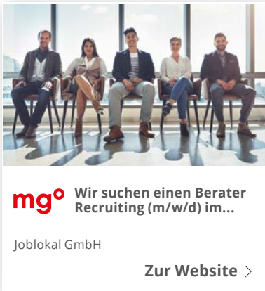
Beispiel: MRB-Technologie auf Google Display (stationär)