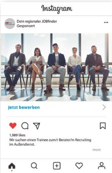
Beispiel: MRB-Technologie auf Instagram