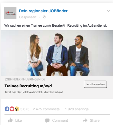
Beispiel: MRB-Technologie auf Facebook